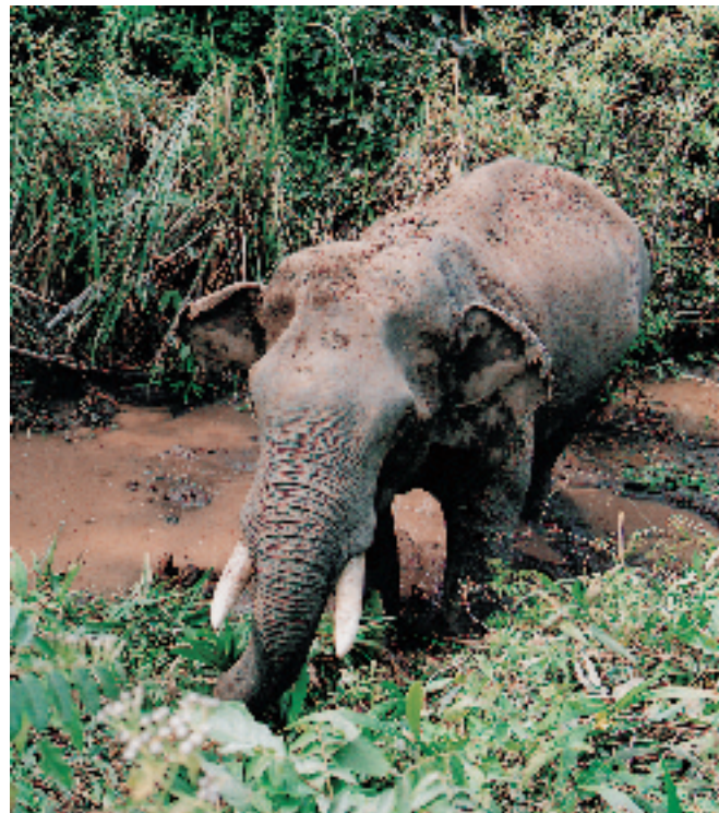
The Plai Jumbon's old name was Plai Ploi

At the moment, there are 10 elephants under preparation. The 7 female elephants are Pang Jarunee, Pang Doo, Pang Yai, Pang Maeboonkaew, Pang Thongkam, Pang Maekammoon and Pang Porntida. The rest of the male elephants are Plai Somchai, Plai Seela and Plai Jumbon (Its old name was Plai Ploi).