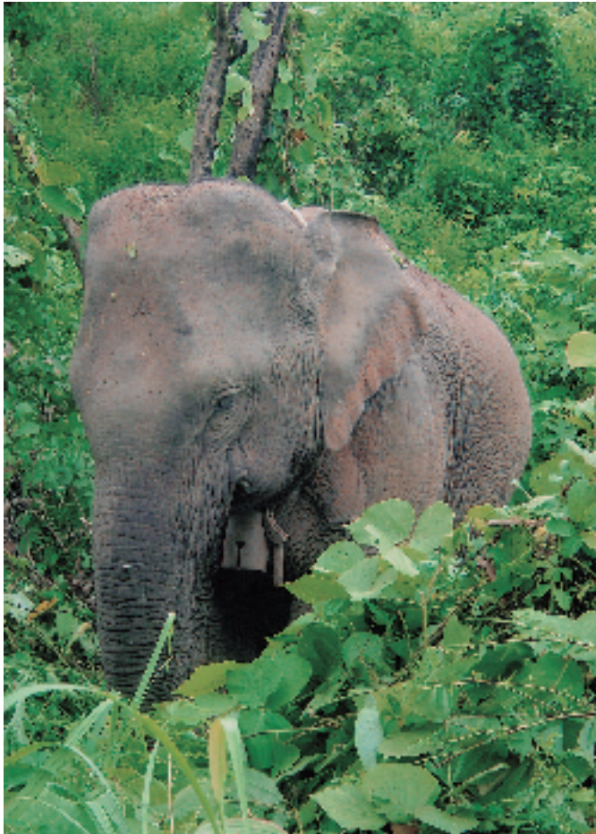
พังพริดา