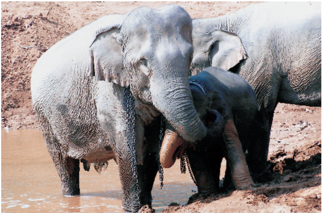
พังแม่บุญแก้ว พังทองคำ และพลายสมชาย