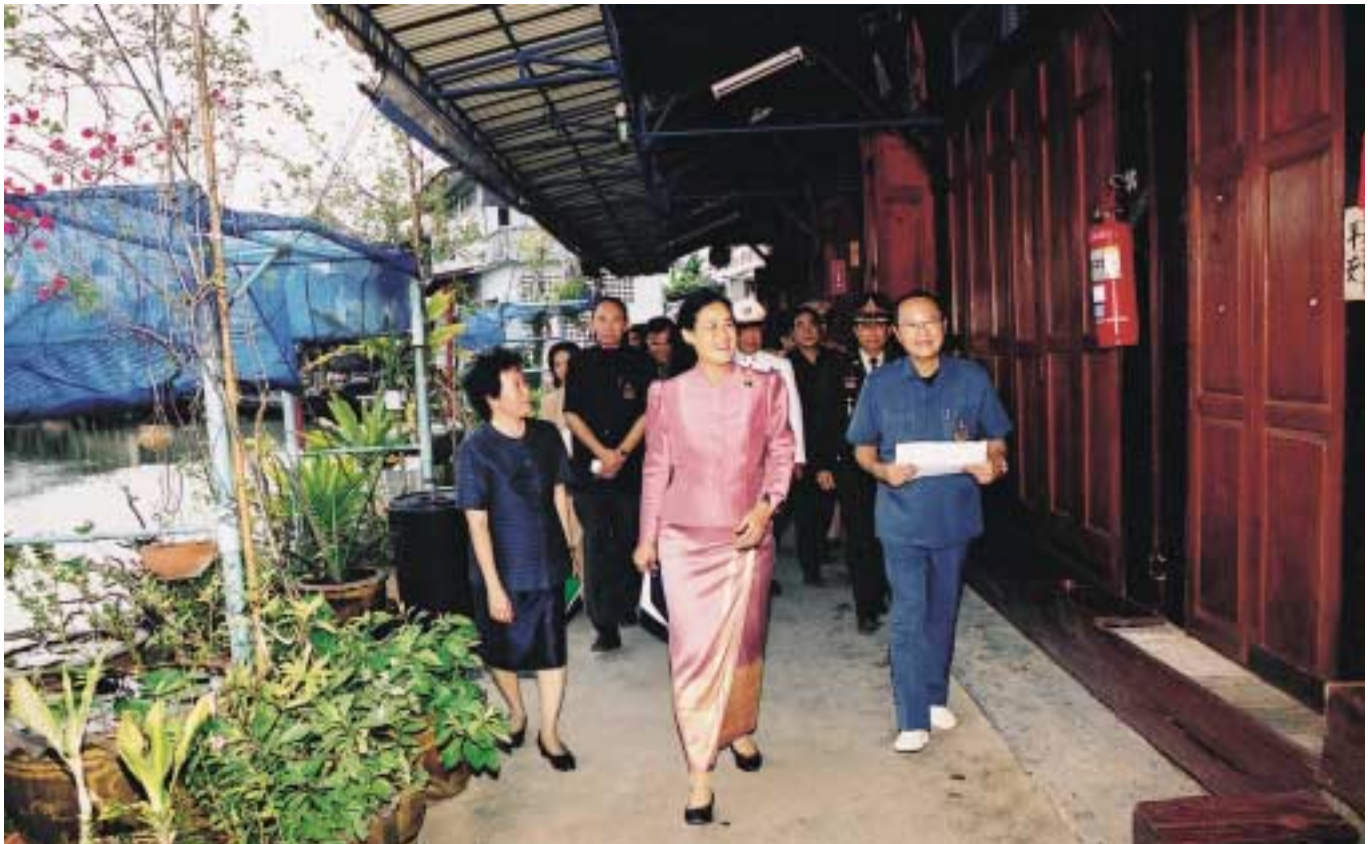
ทอดพระเนตรเรือนแถวไม้

การร่วมมือร่วมใจในการอนุรักษ์เพื่อย้อนรอยอดีตนี้ เกิดประโยชน์หลายด้าน ทั้งในด้านประวัติศาสตร์ที่สำคัญของชาติไทย ด้านศิลปวัฒนธรรมที่มีเอกลักษณ์เฉพาะถิ่น โดยเฉพาะวิถีชีวิตริมน้ำแบบดั้งเดิมที่ยังมีสภาพค่อนข้างสมบูรณ์ แหล่งผลิตศิลปปิ่น ศิลปหัตถกรรมชั้นเยี่ยมของชาติ เครื่องเบญจรงค์ชั้นดีที่งดงาม และที่สำคัญ คือ ด้านระบบนิเวศน์ เป็นการฟื้นฟูแหล่งขยายพันธุ์ตามธรรมชาติที่สำคัญของสัตว์น้ำ นก และแมลง เป็นแหล่งที่มีภูมิประเทศที่สวยงาม มีความร่มรื่นเป็นธรรมชาติ ตลอดจนเป็นส่วนผลไม้ที่อุดมสมบูรณ์และหลากหลายที่สุดในภาคตะวันตก มีศักยภาพมากพอที่จะพัฒนาเป็นแหล่งท่องเที่ยวทางวัฒนธรรม