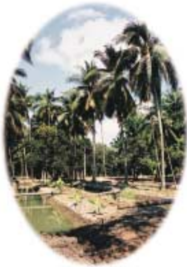
บางข้างสวนนอกในสภาพปัจจุบัน

ณ วันนี้ ชุมชนอัมพวาได้มีการรวมกลุ่มของชาวบ้านจัดกิจกรรมที่สำคัญต่างๆ บนฐาน ของความรัก ความสามัคคี เพื่อพัฒนาสังคมเล็กๆ แห่งนี้ ให้ก้าวหน้าไปอย่างมั่นคง กิจกรรม ที่ทำอยู่เน้นในเรื่องของการนำเสนอเอกลักษณ์ทางศิลปะ วัฒนธรรมท้องถิ่น รวมทั้งการ ท่องเที่ยวในเชิงอนุรักษ์ ชมสวนเกษตรที่อุดมไปด้วยผลไม้หลากหลายพันธุ์ ชมวิถีชีวิตที่ เรียบง่ายผูกพันกับธรรมชาติ ซึ่งเป็นสิ่งที่ชาวอัมพวารักและภาคภูมิใจที่จะนำเสนอสู่สายตาสังคม ภายนอกอย่างเต็มใจ และเป็นอีกกิจกรรมหนึ่งที่มูลนิธิชัยพัฒนาได้เข้าร่วมเพื่อให้เกิดการพัฒนา เข้าสู่ความสมดุล และสอดคล้องกับพระราชกระแสว่า “ภูมิสังคม” ซึ่งนำไปสู่การพัฒนาชุมชน ที่เข้มแข็ง รู้รักสามัคคี อันเป็นความสุขสมบูรณ์ของสรรพนาหาชีวิตที่เกื้อกูลกันอย่างแท้จริง