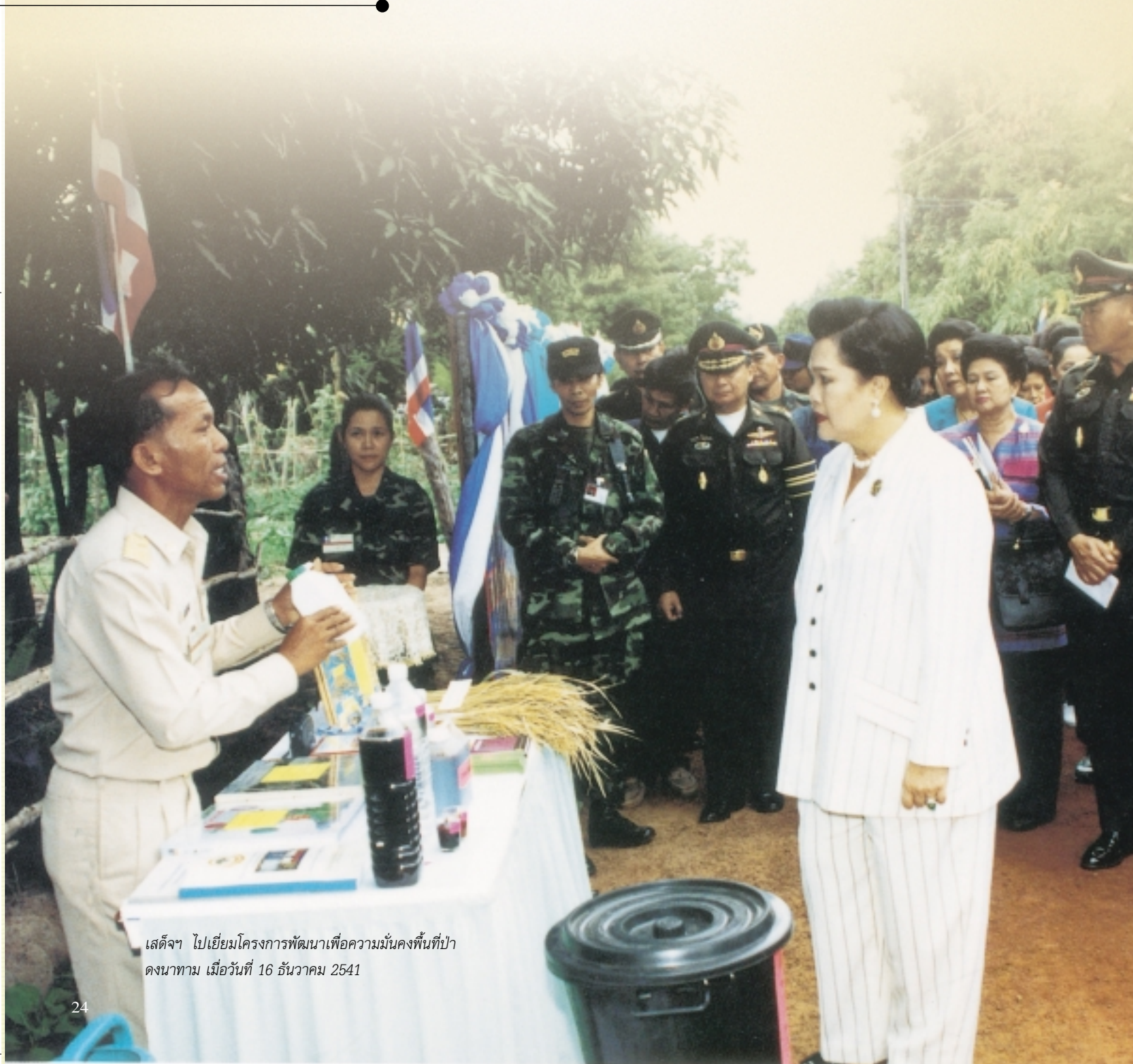
เสด็จฯ ไปเยี่ยมโครงการพัฒนาเพื่อความมั่นคงพื้นที่ป่า ดงนาทาม เมื่อวันที่ 16 ธันวาคม 2541